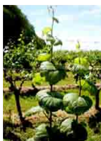
SÍNTOMAS DE LA ENFERMEDAD: HOJA DE MALVÓN EN EL FOLLAJE.

» Una vez finalizada la época de cosecha asegúrese de eliminar todos los racimos que queden en la planta . Esto evitará que plagas y enfermedades pasen el invierno en ellos.